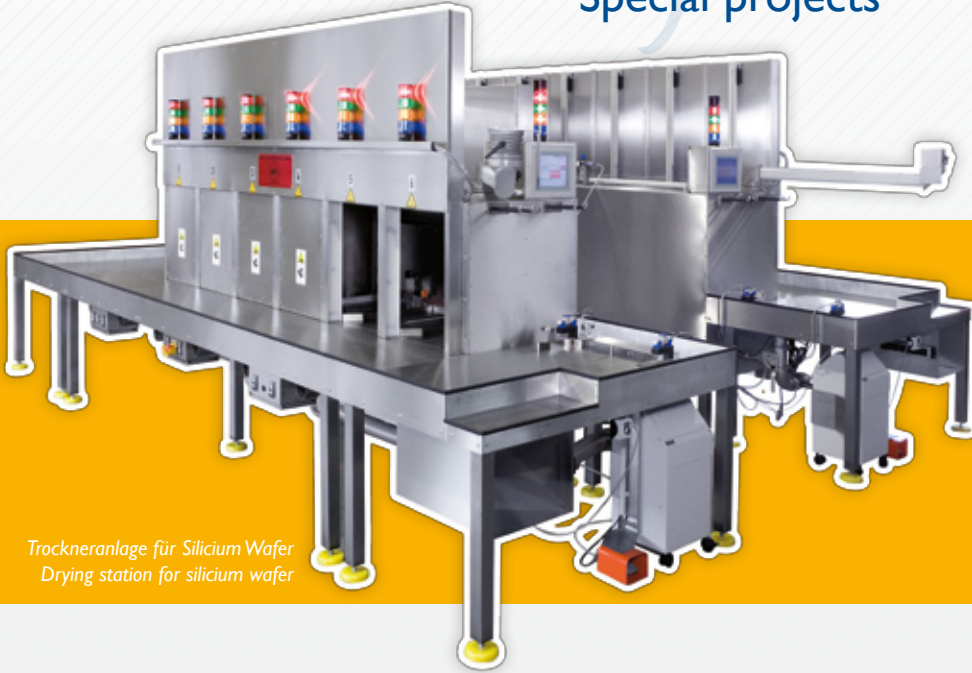
Trockneranlage für Silicium Wafer Drying station for silicium wafer