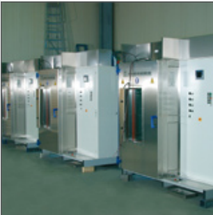
Klimaschränke Climate cabinets