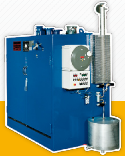
Ex Elektro Vakuu-Fasrockner mit Kondensator Ex electrical vacuum-drum dryer with condensor