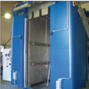
Gas Ofen (500 C) als Beschichtungstrockner Gas heated furnace for surface coating