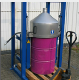
Beheizte Reststoffverdampfung aus 200 l Fässern Heated vaporization of waste material for 200 l drums